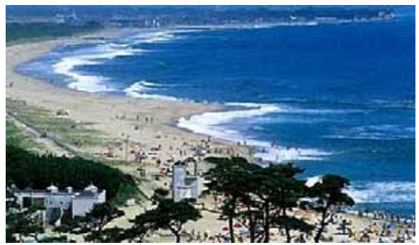
伊師浜海岸（日立市）