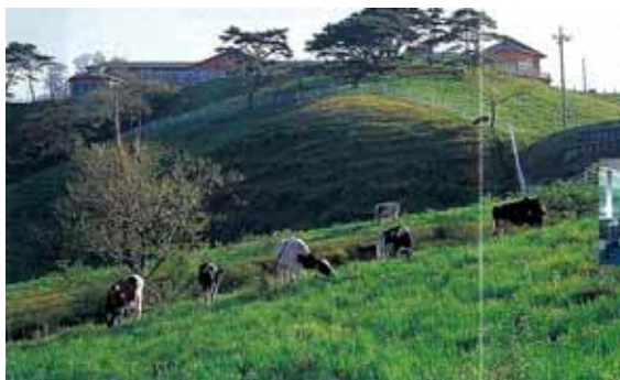
里美牧場プラトーさとみ（常陸太田市）