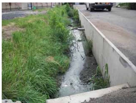
生活雑排水が流れ込む水路