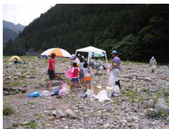
河川パトロールの様子