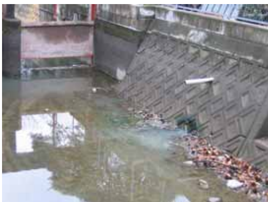
農業用水取水堰上流に流れ込む雑排水