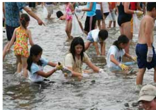
河川愛護活動（鬼怒川クリーン作戦）での「マスつかみどり」