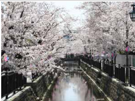
市街地を流れる八瀬川の親水護岸