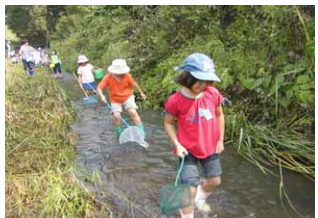
小学生の生き物体験学習