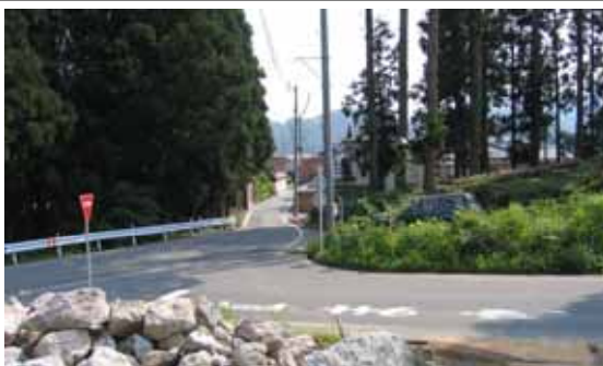
町道津川弘川線と広域農道東蒲原地区との交差点。営農団地からの農産物流通の高速化を図る。