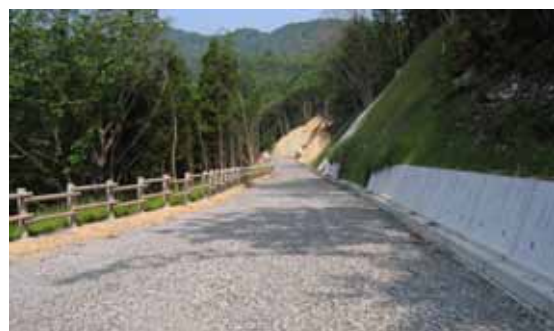
県営林道西山日光寺線。保育面積の向上等適切な森林管理を図る。