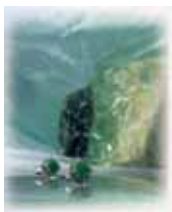
ヒスイの原石と加工品