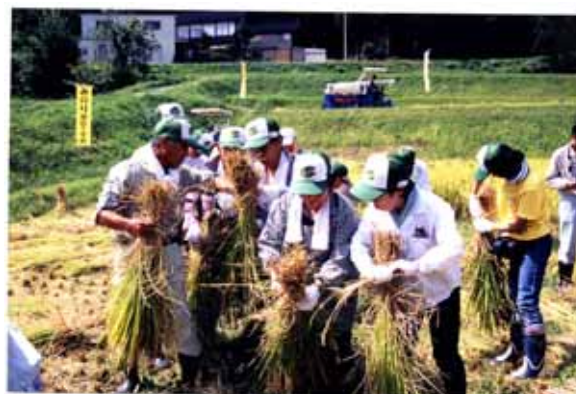
棚田で実施されている都市住民の体験農業 (グリーンツーリズムの推進)