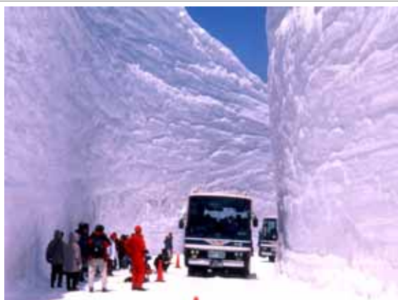
国際観光地立山黒部アルペンルート雪の大谷