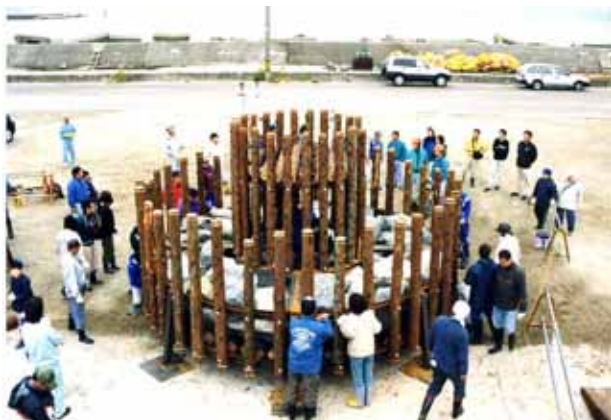
林業関係者と漁業関係者の共同作業によって制作された、間伐材を利用した木製の魚礁 (森とまち、海をつなぐ交流の促進)