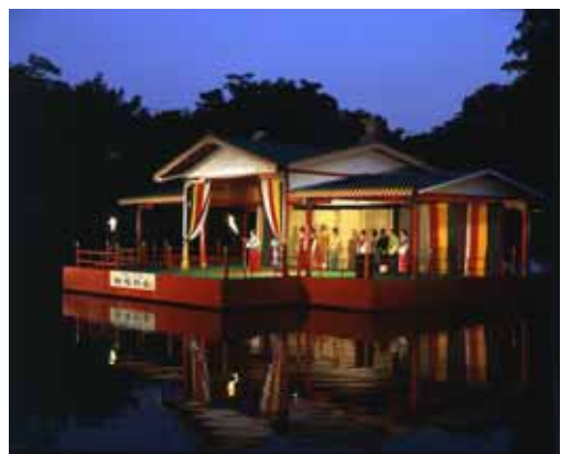
万葉集ゆかりの地として毎年開催される、市民参加のイベント高岡万葉まつり