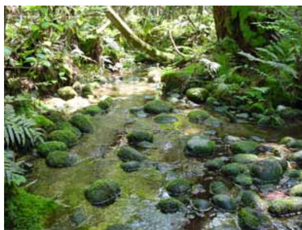
海岸近くに自噴する湧水 (国指定天然記念物杉沢の沢スギ)