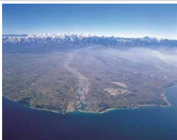
豊富な水資源に恵まれた 黒部川の扇状地に広がる平野と山間部