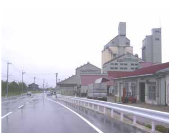
大規模農業施設（カントリーエレベータ等）の効率的な利用が全市で可能となる。