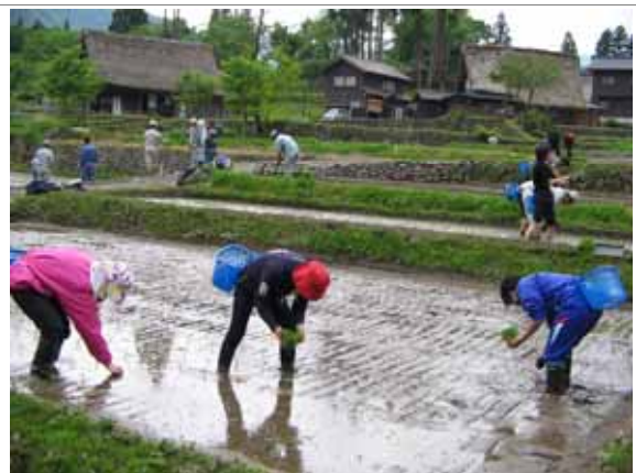
世界文化遺産合掌集落と周辺の棚田で実施されている都市住民との交流。