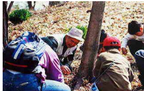
環境教育（オオムラサキの越冬幼虫調査）