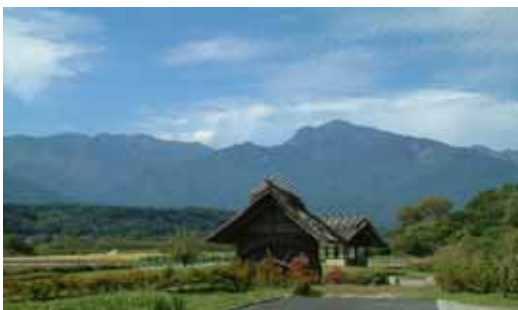
美しい景観形成の保全