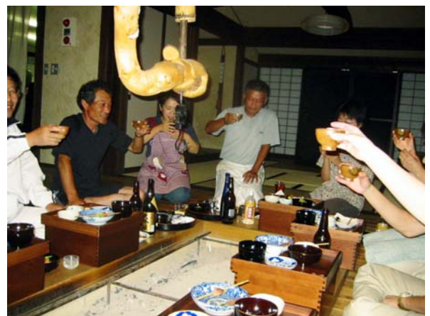
出来上がったドロブクで乾杯