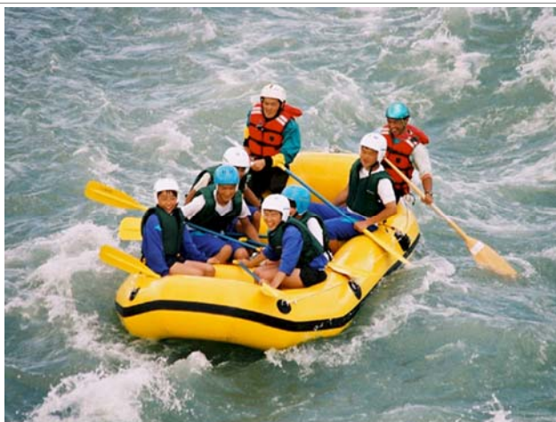
体験教育旅行で天竜川を川下り