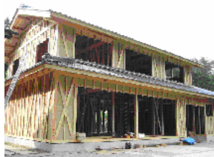
建築中の「東濃ヒノキの家」