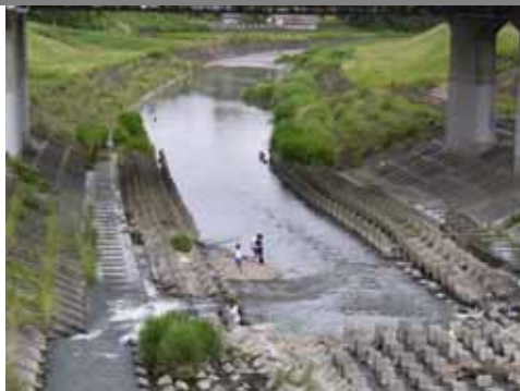
現在の菊川で遊ぶ子供の様子