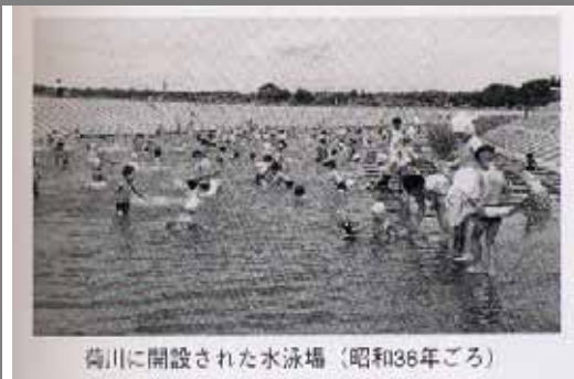
菊川に開設された水泳場（昭和36年ごろ）