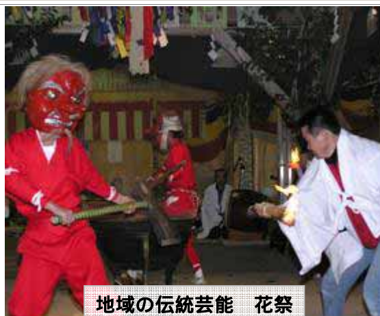
地域の伝統芸能 花祭