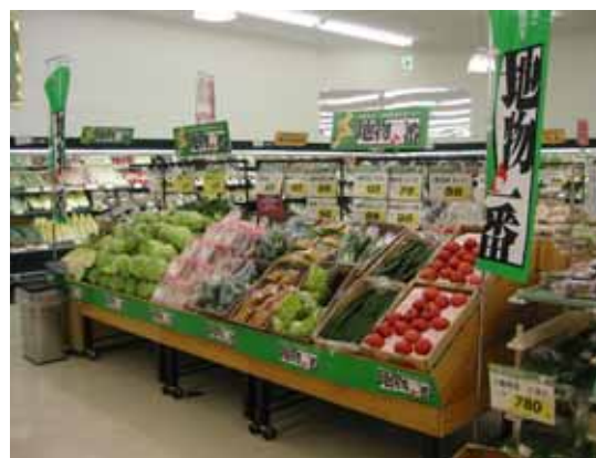
地物一番の日キャンペーン協賛店