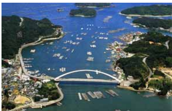
主要道のパールロードと真珠の養殖筏