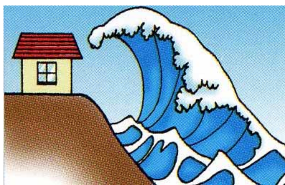
懸念される風水害と地震津波