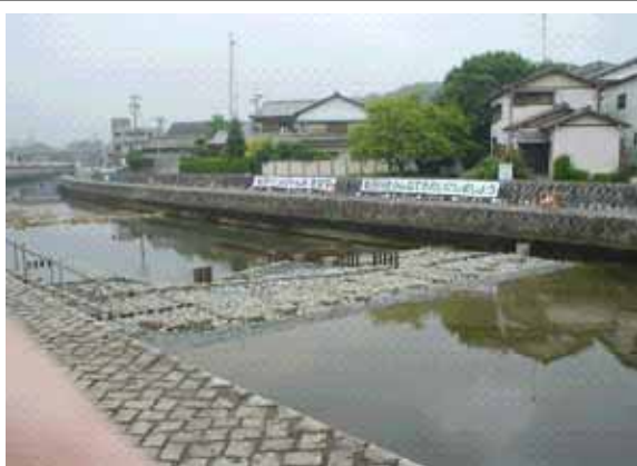
勢田川「とおりゃん瀬」 みんなで考え、みんなで作った落差工