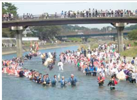
清流「五十鈴川」での初穂曳