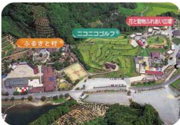
ふれあいの場【五桂池ふるさと村】