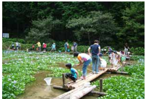
自然とのふれあい【ビオトープ】