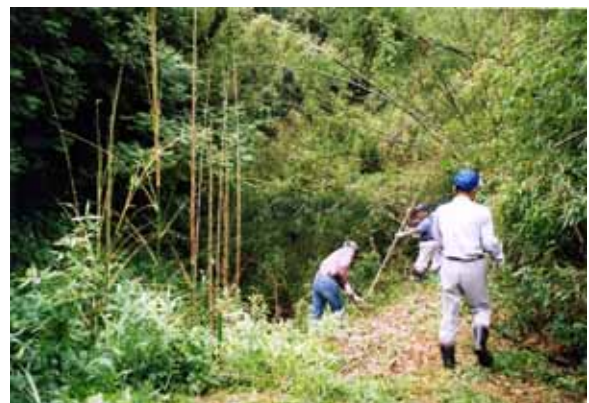
住民参加による造林保育と森林の整備