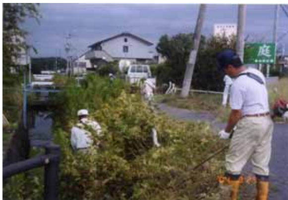
住民参加による河川・水路の清掃活動