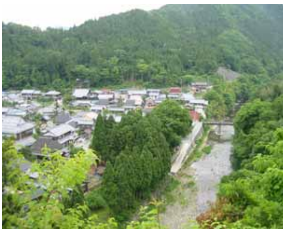
自然豊かな住み良いまち