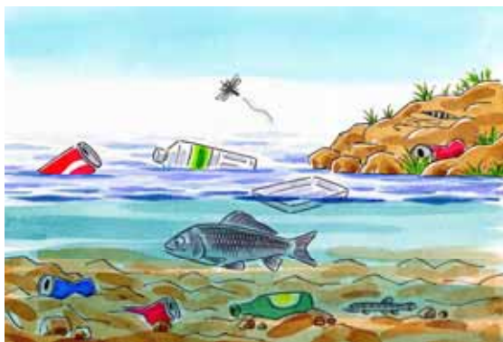
川はゴミ箱ではないのに！