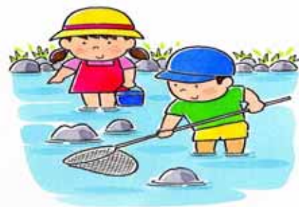
水と親しむ楽しいひととき