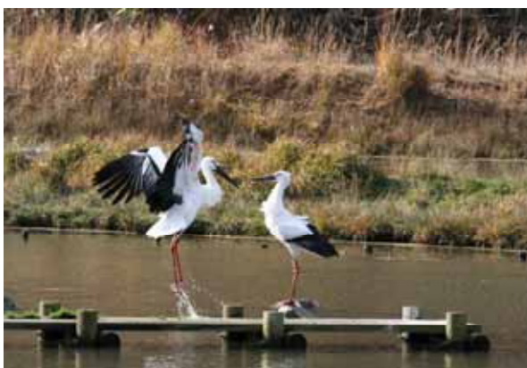
コウノトリ野生復帰への活動