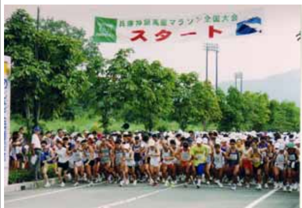
参加者 5 千人の神鍋高原マラソン大会