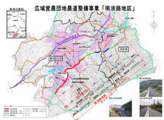
（広域農道・市道の一体的な整備）