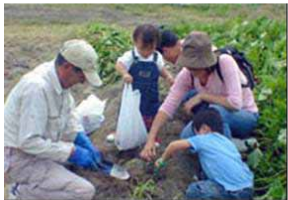
（農村型体験交流施設での産直物販・食の体験教室）