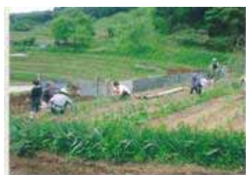
農林業の推進 と山村交流