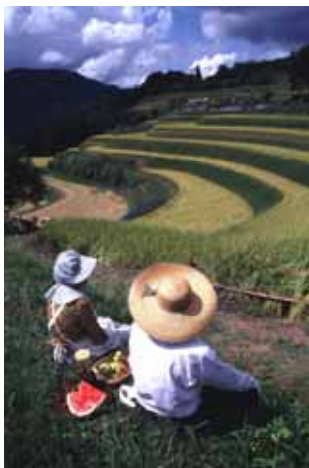
日本の棚田百選 (和佐父西ヶ丘地区)