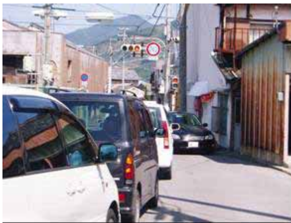
町道中井原本線渋滞状況