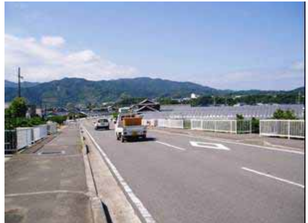
国道 424 号付近の施設（ハウス栽培）