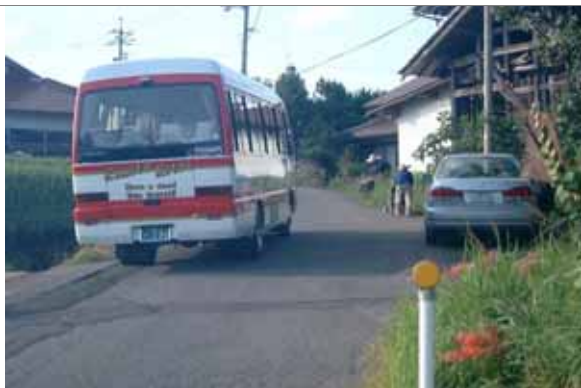
整備前イメージ：幅員が狭く通行が困難