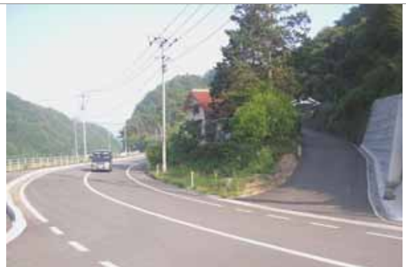
整備後イメージ：現道が改良され車両の通行がスムーズ