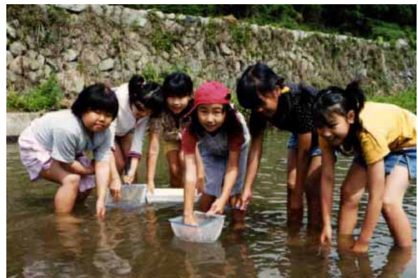
水生生物観察会（採取した生物で水質検査を行った）