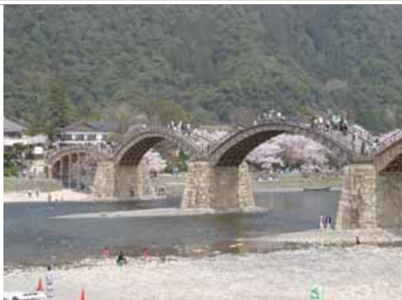
錦帯橋の下を流れる清流錦川