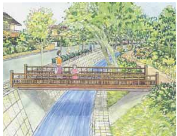
水辺空間イメージ図