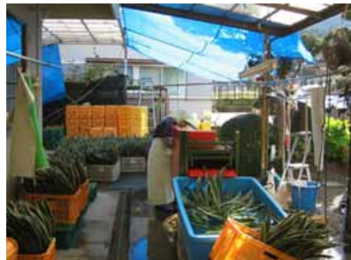
地域の農業（オモト選別作業）