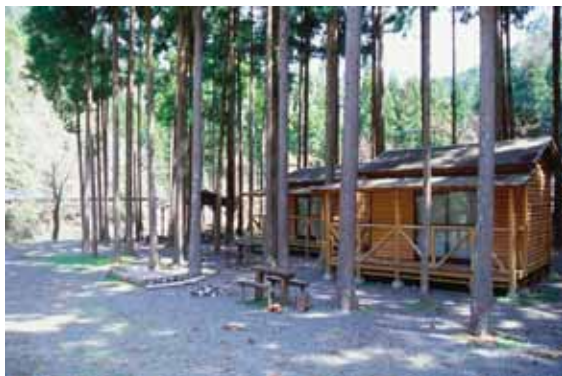
観光施設（美那川キャンプ村）