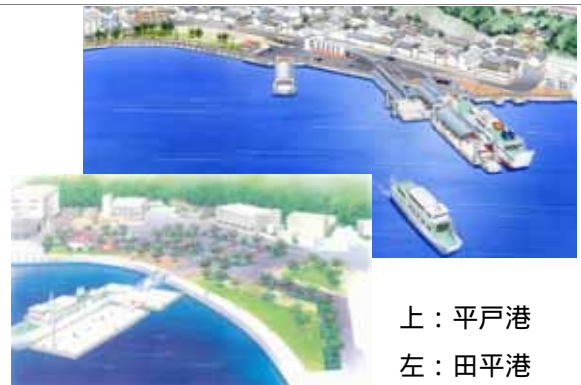
上：平戸港 左：田平港