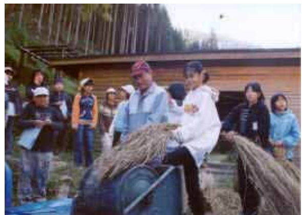
「森のエコスクール」