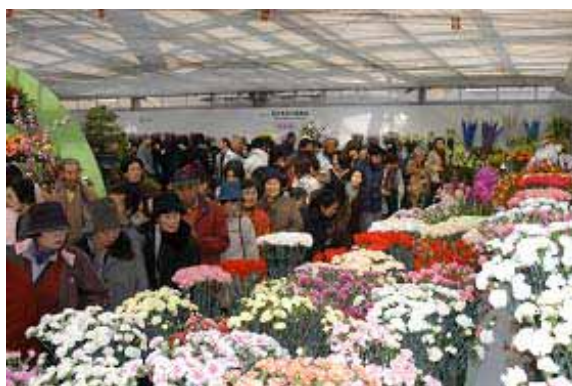
とちぎ花フェスタ2006 in かぬま (花木センター)