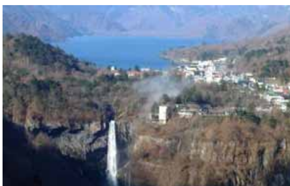
日光国立公園（中禅寺湖、華嚴の滝）