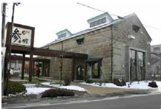
氏家駅東 商業集積活性化施設 e プラザ参番館