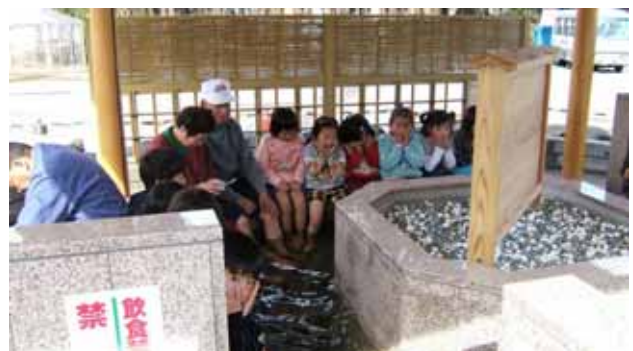
喜連川地区 お丸山公園の足湯