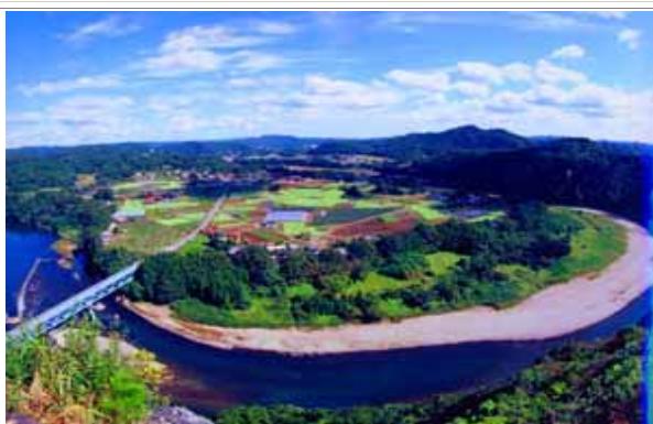
那珂川県立自然公園 (そばの里牧野のそば畑)