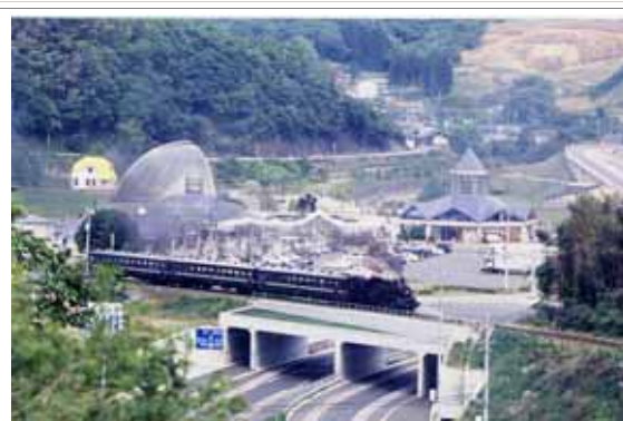
S L が走る道の駅「もてぎプラザ」