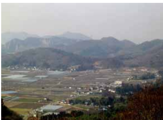
太平山県立自然公園