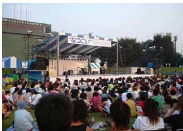
夏のイベント“なつこい”