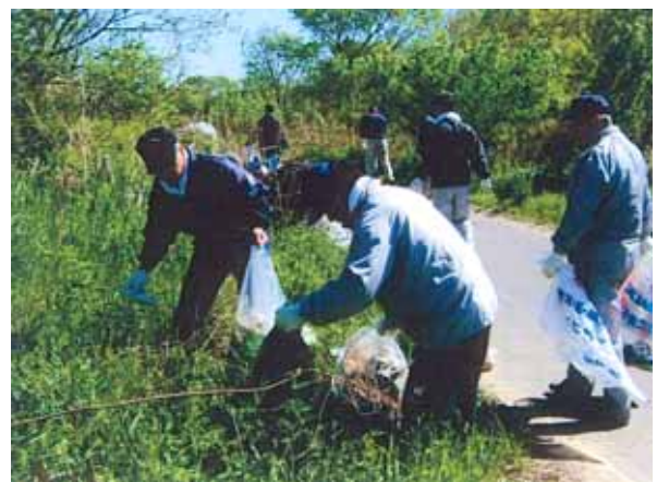
渡良瀬遊水地クリーン作戦