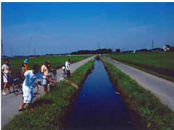
用水路で遊ぶ子どもたち