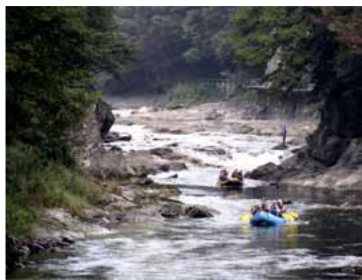
清らかな水を活用したラフティング