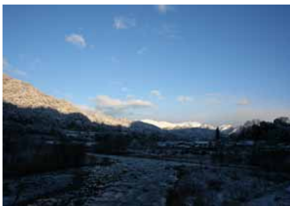
雪の中の谷川岳と利根川の清流