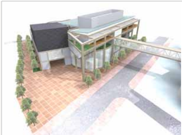
中心市街地活性化拠点施設イメージ