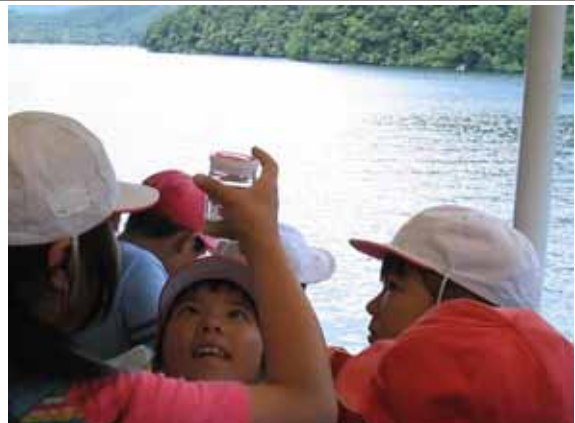
野尻湖クリーンラリー