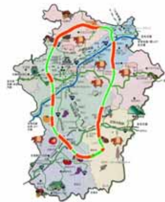
伊賀コリドール計画