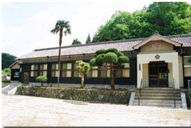
地域の活動拠点 博要の丘（旧博要小学校）