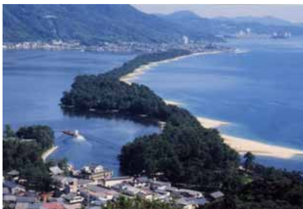
日本三景『天橋立』 飛龍観