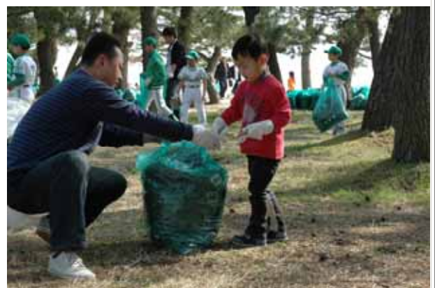
『クリーンはしだて1人1坪大作戦』 「天橋立を守る会」による清掃・美化活動