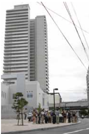
NPO法人が開設・運営している劇場と高層マンション