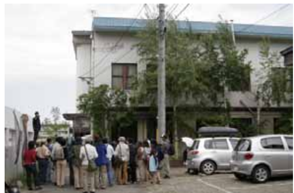
地域発見のワークショップ