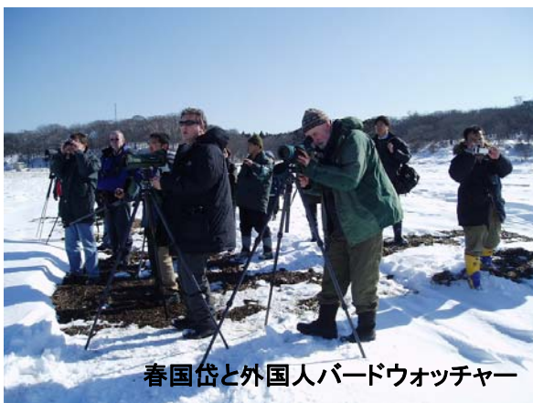
春国岱と外国人バードウォッチャー