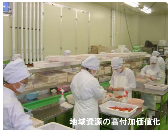
地域資源の高付加価値化