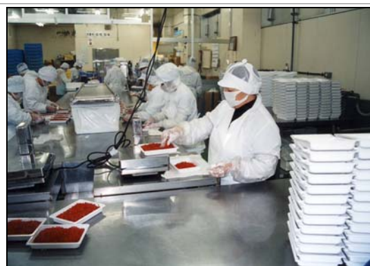
安全・安心、高品質な食品づくり (イクラづくりの様子)