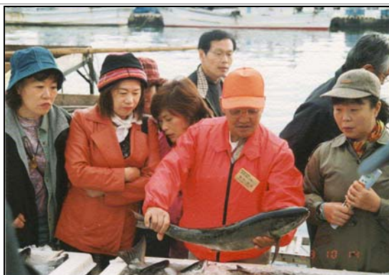
地域資源を活用したエコ・ツーリズム事業 (鮭荷揚げ見学の様子)