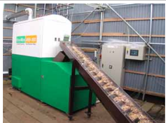
高含水率樹皮等対応ボイラー のイメージ