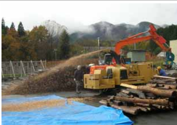
間伐材や端材のチップ化による 燃料利用推進