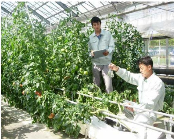
光触媒を使ったトマトの栽培