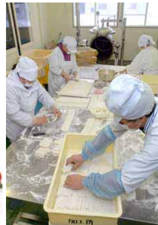
「妙高ブランド」の確立を目指して トマトケチャップなど農林産物加工を行う