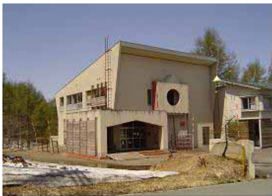
支援措置により有効活用を図る 「旧斑尾高原保育園」