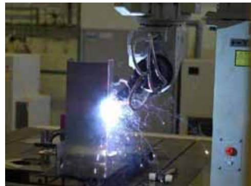
レーザー溶接による最先端アルミ加工技術の開発