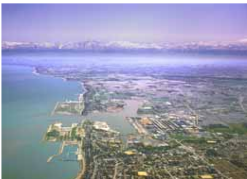
環日本海交流の拠点 富山新港臨海工業用地